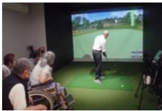
シミュレーションゴルフ

足立区初のシミュレーションゴルフ・歩行ロボット完備の充実した通所介護施設です。「心温かく穏やかな生活と豊かな人生」をコンセプトに、利用者様にはいつでも「なりたい自分」を目指していただけるよう、多様な日替わり講座からご自身で好きなプログラムを選んで過ごしていただけます。講座は「よく学びよく遊びよく鍛える」をモットーに、認知症予防の学校式アクティビティ「おとなの学校」や、暮らしを彩るさまざまなカルチャー講座、デイケアとは一味違う楽しい運動プログラム（機能訓練）を実施しています。また、充実した入浴設備やウォーターマッサージベッドなどの癒し空間、毎日のお食事も大好評いただいております。