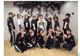
私たちがお待ちしております

施設を見たいという方がいらっしゃいましたら、遠慮なくお声がけ下さい。見学送迎対応も行っております。紙面では伝わりきらない魅力を感じていただけるはずです。これからもスタッフ一丸となり、わくわく倶楽部等潤を盛り上げていきます。