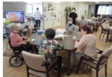
テイルームでの談笑タイム

移転前は、旧・常楽診療所併設の通所リハビリテーションでしたが、新しいプラザではいわゆる「運動リハ」に特化したデイケアと「生活リハ」へと進化したデイサービスとに分け、それぞれの機能・サービスを高める挑戦を始めたのですが、最近はその手応えも感じています。